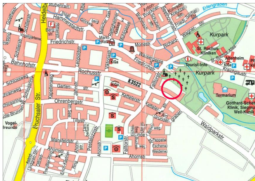
Ausschnitt aus dem Ortsplan von Bad Mingolsheim mit Darstellung des Geltungsbereiches

Im Nord-Osten grenzt der Geltungsbereich an die „Waldparkstraße“ sowie im Süd-Osten an das Friedhofsgelände an. Damit befindet sich das Plangebiet in einer zentralen Lage zwischen der historisch gewachsenen Ortskern-Bebauung des Ortsteiles Mingolsheim und dem Gelände des Kurparks.