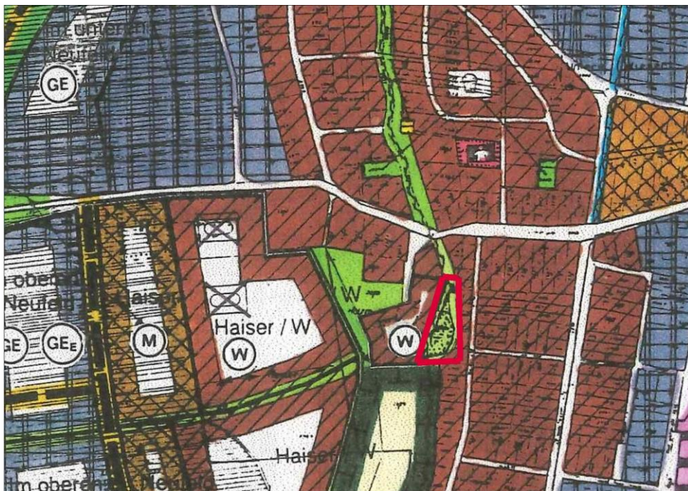
Auszug aus dem rechtskräftigen Flächennutzungsplan der Vereinbarten Verwaltungsgemeinschaft Bad Schönborn – Kronau

Im rechtskräftigen Flächennutzungsplan der Vereinbarten Verwaltungsgemeinschaft Bad Schönborn – Kronau ist die in den Geltungsbereich des Bebauungsplanes einbezogene Fläche der derzeitigen Nutzung als eine „innerörtliche Grünfläche“ ausgewiesen. Der Flächennutzungsplan wird im Wege der Berichtigung angepasst.