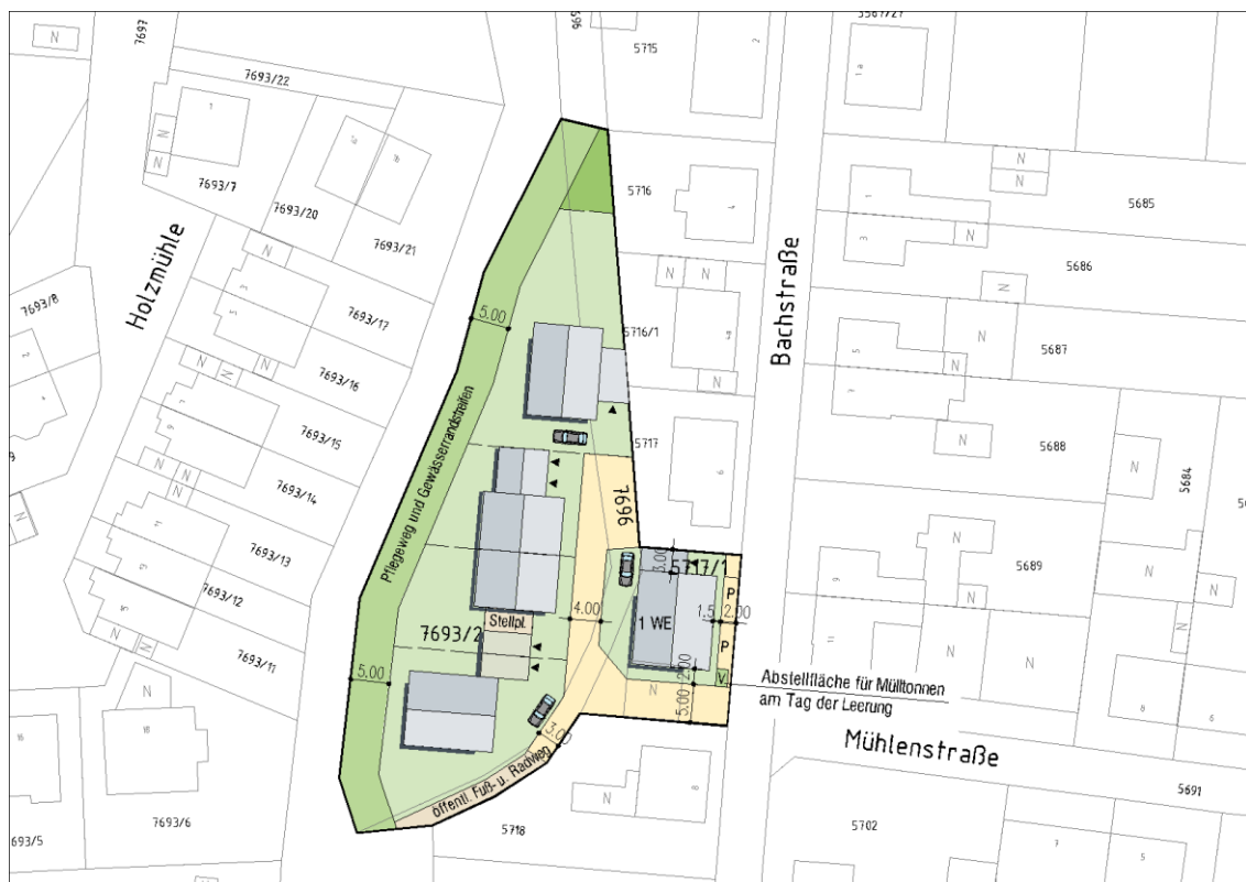
Abbildung des der Planaufstellung zugrunde liegenden städtebaulichen Konzeptes

Es ist das erklärte Ziel der Gemeinde Bad Schönborn, mit Blick auf die bestehende Verkehrsbelastung in der „Bachstraße“, aber auch aufgrund der unmittelbaren Lage am „Kraichbach“ und der an das Plangebiet an- grenzenden städtebaulichen Strukturen, hier eine nicht zu hohe bauliche Dichte zu ermöglichen. So sieht das städtebauliche Konzept des Bebauungsplanes die Schließung der vorhandenen Baulücke entlang der „Bachstraße“ sowie, im rückwärtigen Bereich, die Ausbildung von zwei Doppelhaus-Grundstücken sowie zwei Grundstücken zur Errichtung von Einzelhäusern vor.